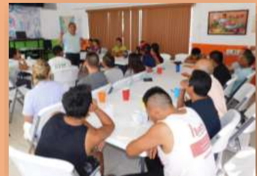
Sesiones de terapia y de estudio