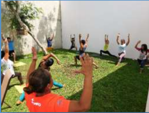
Talleres y voluntariado