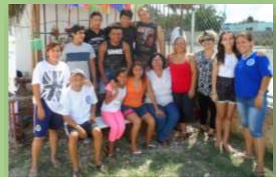
Actividades familiares y recreativas