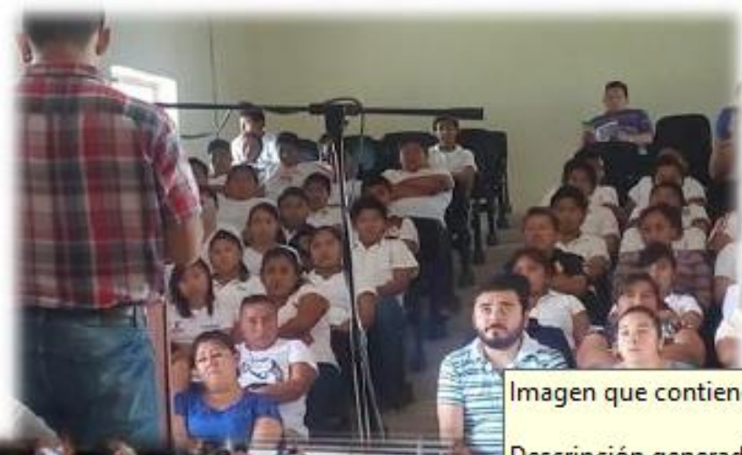
Imagen que contiene período